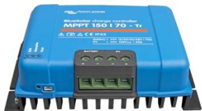
Controlador de carga solar MPPT 150/70-Tr