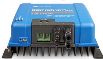
Controlador de carga solar MPPT 150/70-MC4